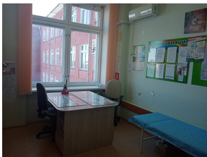
кабинет врача- педиатра;