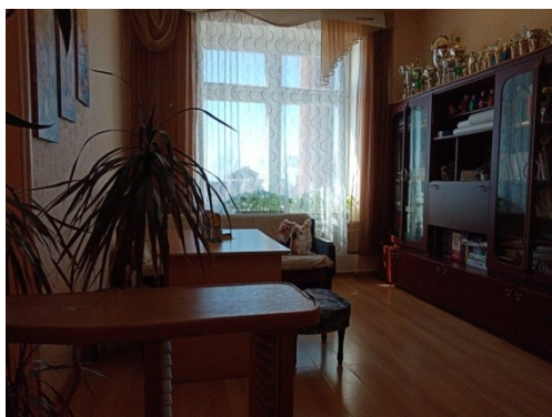
отделения социальной реабилитации (приют)