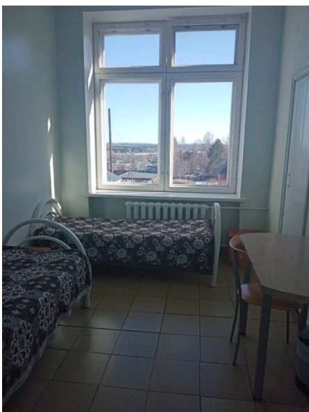
2 изолятора на 4 спальных места;