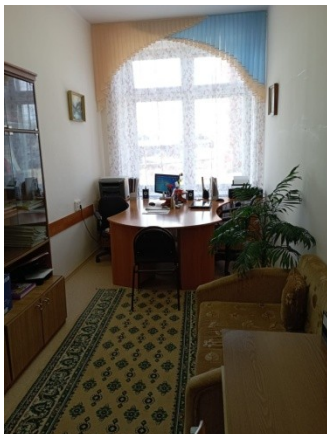
Кабинет социальных педагогов