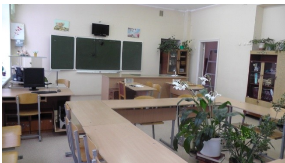
кабинет кружковой работы