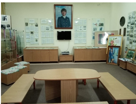
Музей им. Н.В. Курченко